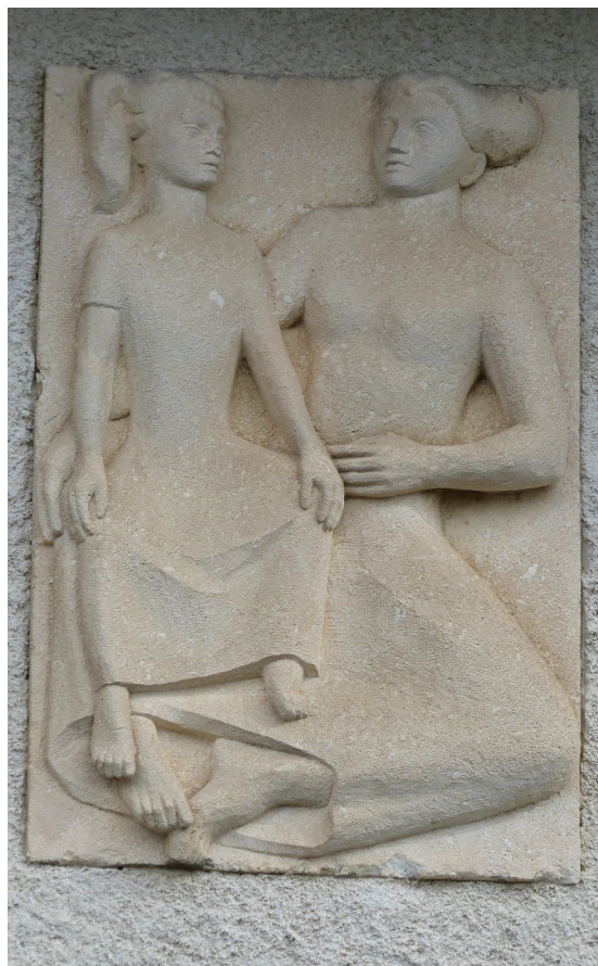
Jean Cardot, bas-relief, Ecole Publique de Freycenet, 1954

Des réunions seront aussi organisées avec les lecteurs/citoyens afin de définir ensemble les futurs usages de cet équipement qui devrait être mis à la disposition du public à la fin 2023.