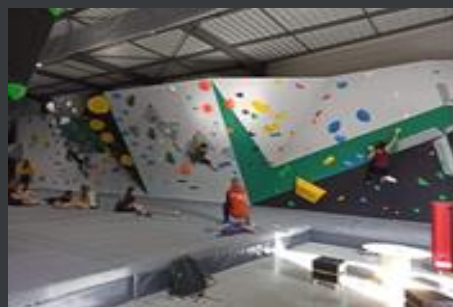
Protection sport et loisirs