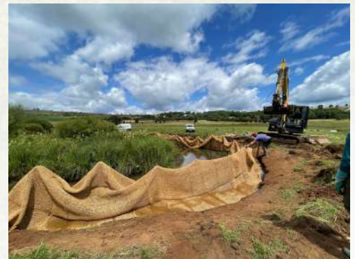
Restauration de berges sur le ruisseau les Merles