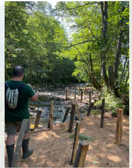
Restauration hydromorphologique sur l'Auze