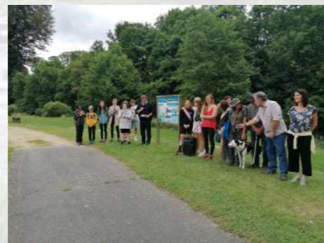
Fête du Lignon