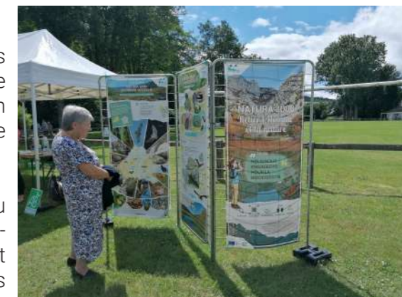
Exposition Natura 2000 lors de la fête du Lignon

L'ambition de ce projet est d'accompagner les agriculteurs vers des pratiques plus durables, en particulier dans un contexte climatique changeant où la ressource en eau et les milieux naturels sont menacés.