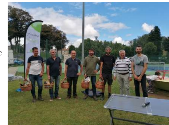
Concours des prairies fleuries

En 2023, près de 400m de haies ont été plantées ce qui porte à 1700 m le linéaire plantés depuis 2021 dans le cadre du CTLV.