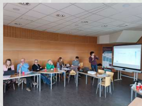
PETR de la Jeune Loire

Le 2 juillet 2023 à Tence s'est tenue la Fête du Lignon avec au programme : escape game sur le thème du développement durable, balades découvertes avec Marine Schmitt, naturaliste, atelier pêche à la mouche, découverte de Natura 2000 via une exposition, présentation des espèces protégées. Cet événement fut l'occasion d'inaugurer le sentier pédagogique « Au fil des rivières ». Ce parcours est composé de 7 panneaux, il relie les deux rivières principales de Tence : la Sérigoule et le Lignon. Il a été réalisé au cours de l'année avec le conseil municipal des jeunes de Tence qui ont réalisé les illustrations et l'atelier E3D du collège de la Lionchère qui ont proposé un jeu de piste.