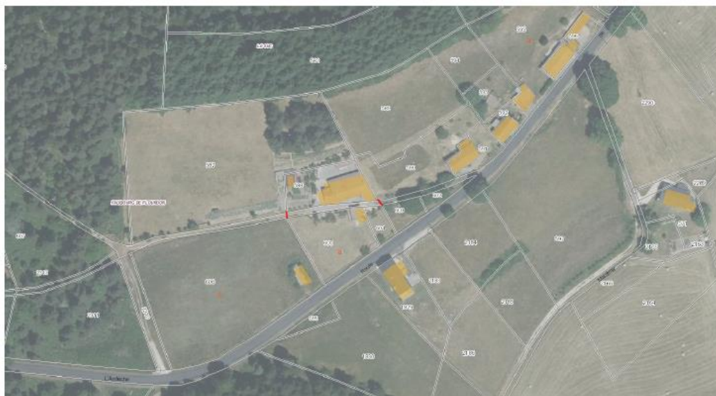
PLAN PARCELLAIRE AVEC DESIGNATION DES PROPRIETES RIVERAINES CHEMIN RURAL LE FAUBOURG DU FLOURDON